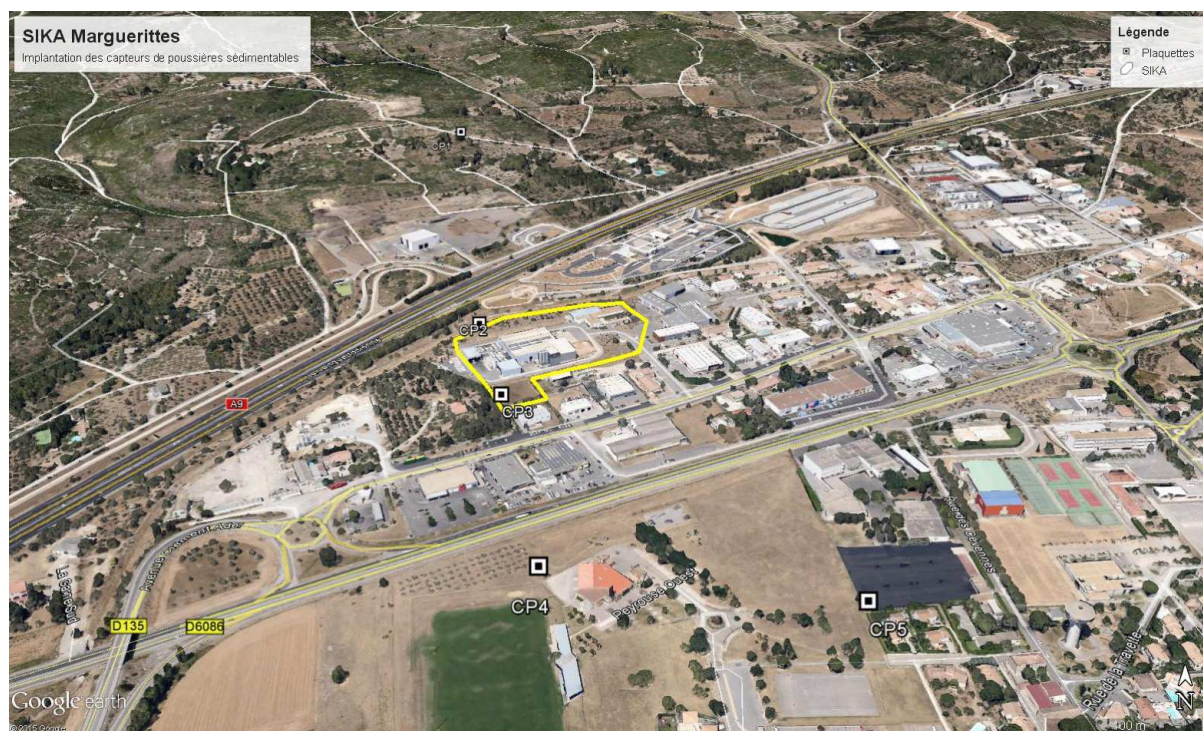
Figure 1 : Plan de situation du site avec position des plaquettes de surveillance des retombées de poussières (CP1 et CP5)

L'usine est située dans la zone d'activités de Marguerittes (ZAC du TEC), à proximité d'établissements à caractère commercial, de service et de production (confiserie d'olives, béton prêt à l'emploi, funérarium, mécanique automobile, supermarché...) et d'une habitation isolée, située à 60 m du coin sud-ouest de l'usine.